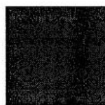
Pantone 3005 C