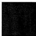
Pantone 484 C