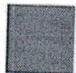
Pantone 3005 C