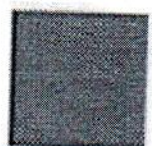
Pantone 484 C