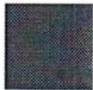
Pantone 484 C