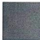
Pantone 3005 C