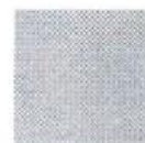
Pantone 123 C