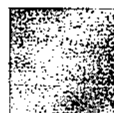
Pantone 123 C