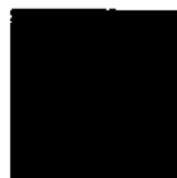
Pantone 3005 C