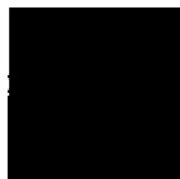
Pantone 484 C