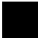
Pantone 3005 C